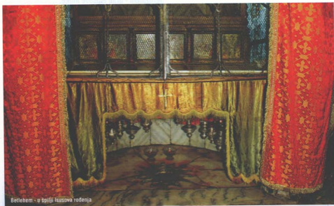
Betlehem - u špilji Isusova rođenja

U razmatranju riječi Božje u štalici dolazi mi slika Marije i Josipa kako traže smještaj. Za njih nema mjesta u svratištu. Svijet vidi Mariju kao trudnicu, ali ne znaju koga nosi u svojoj utrobi - Boga samoga! Mirna je. Puno ne priča, nego moli. Josip je strpljiv, požrtvovan. Ne misli na sebe, već na Mariju i dijete koje treba da se rodi. Imaju pouzdanja. Iako im je teško, osjećaju kako se Bog brine za njih. Nalaze štalicu kao smještaj. Onaj koji je sve stvorio rada se u neznanosti i siromaštvu! U špilji rođenja vrata su malena tako da se pri ulasku treba sagnuti i pokloniti. Povijesno, vrata su napravljena tako malenima, da bi spriječili muslimanske konjanike ulaziti u crkvu. U razmatranju mi dolazi slika Marije kako rada, ali nema porođajne bolove kao ostale žene. Dijete Isus pritom prelazi iz jednoga stanja u drugo poput sunčeve svjetlosti koja prolazi kroz staklo. Možda je to moja mašta. Dolaze mi riječi