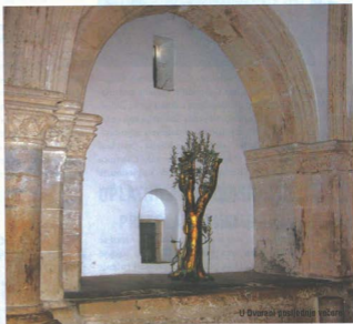
U Otvoreni posvećenost

(BEN GURION - IZRAEL, 28. 12. 2008. GODINE)